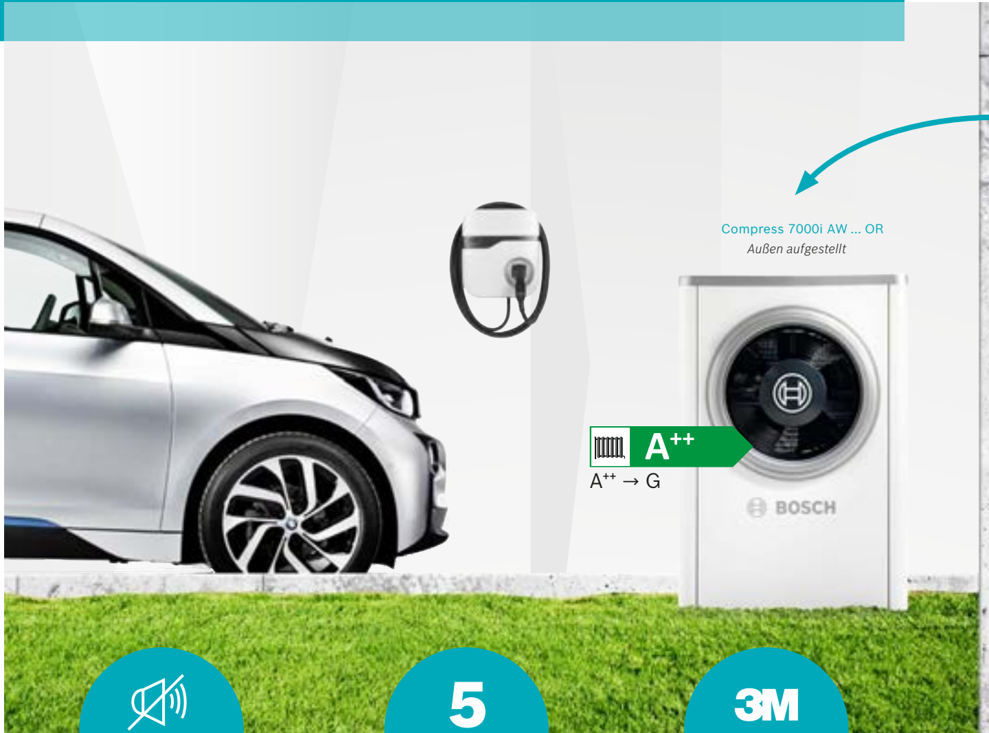
Compress 7000i AW ... OR Außen aufgestellt